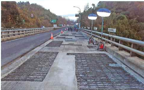
橋梁の舗装下のコンクリートを補修します。