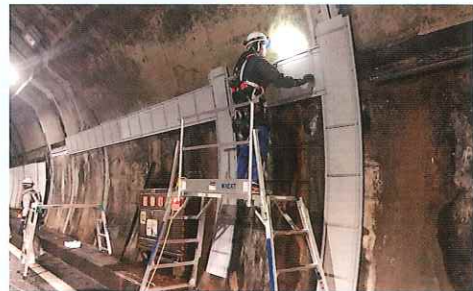
コンクリート壁面の補修や漏水対策を実施します。