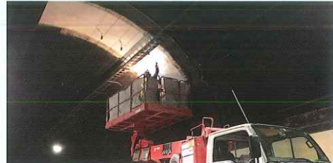
〔トンネル補修工事〕